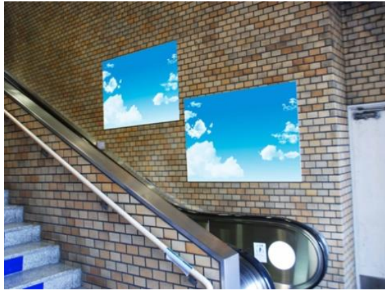
A降車ホーム側エスカレータ壁面