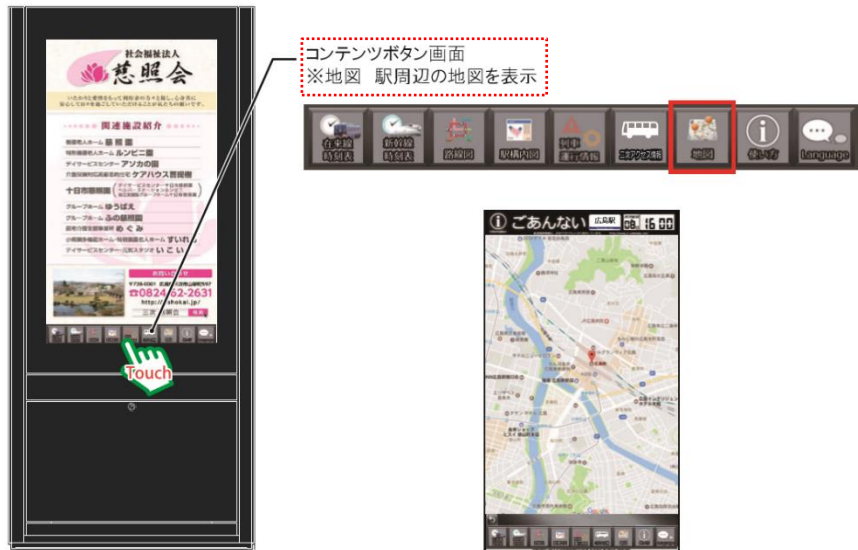
55インチフルHiサイネージコンテンツボタンイメージ

コンテンツボタンをタッチすると、各情報画面に移行します。 【在来線時刻表】 【新幹線時刻表】 【路線図】 【駅構内図】 【列車運行情報】 【二次アクセス情報】 【地図】 【使い方】 ★【Language】※4か国語対応（日本語・英語・中国語・韓国語）★