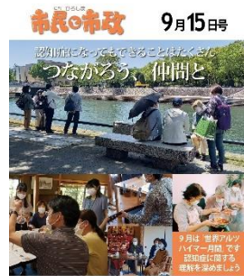
市には、認知症の人や家族、地域で支える皆さんなどが気軽に集まって交流できる「認知症カフェ」や「若年性認知症の人の集いの場」があります。

広島バスセンターは公共的なスペースである為、 【広島市の市情報】 【ニュース配信】 【天気予報】 【占い】 【今日は何の日?】 etc 利用者にお役に立つコンテンツも配信★